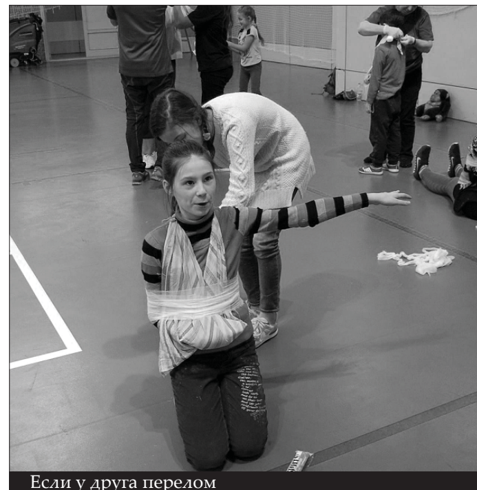
Если у друга перелом