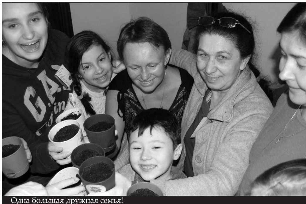
Одна большая дружная семья!

Три дня все участники были Творцами: придумывали новые имена себе и своим пушистым талисманам, создавали портрет Жизни и музыкальные версии сказок на вечере импровизации (кстати, «Курочка Ряба» оказалась мега-хитом!), расписывали пасхальные яйца в чудесном живом музее, подарив жизнь цветам и цветы —