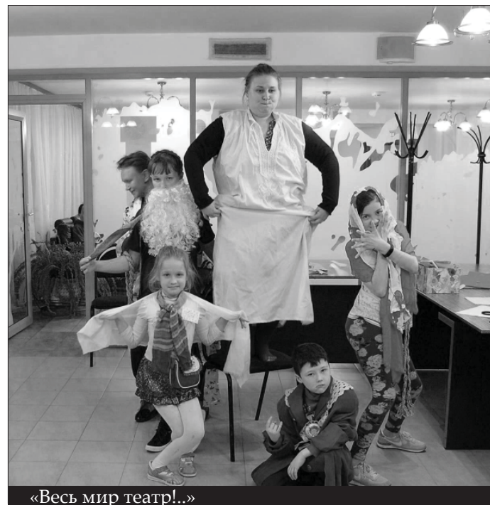
«Весь мир театр!..»