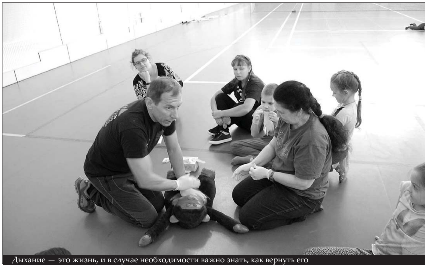
Дыхание — это жизнь, и в случае необходимости важно знать, как вернуть его

Детская философская газета «Сова» Тираж — 500 экз. Адрес: 119991, Москва, Ломоносовский пр-т, д. 27, к.4, философский ф-т МГУ, НМС «Философия—Детям». E-mail: sova@phil4chil.ru, ipo@philos.msu.ru; E-mail главного редактора: greenval@mail.ru Редакционная коллегия выпуска: главный редактор — Арсений Казанцев , корреспонденты — Александра Пхидо, Лёля, У.К.Мастер, Е.Ва , куратор — Алла Кадилова , консультанты: Л.Т. Ретюнских, М.В. Бабалаева, В.В. Селезнева