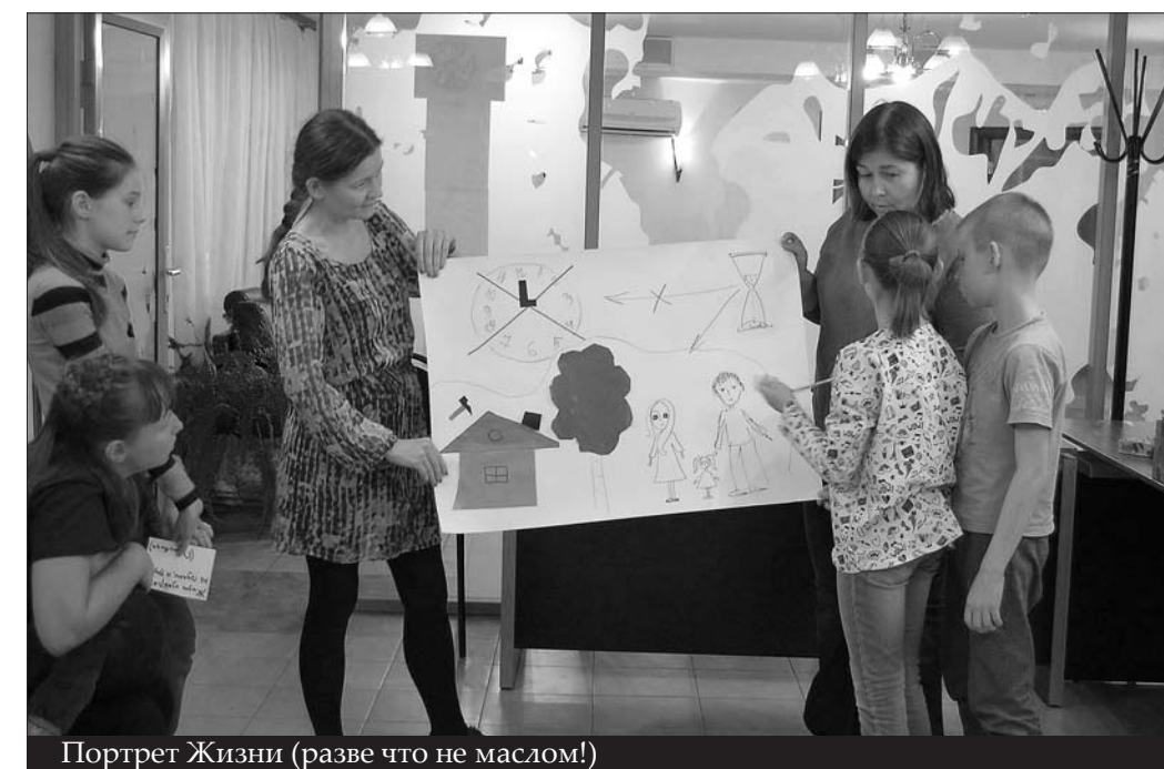
Портрет Жизни (разве что не маслом!)