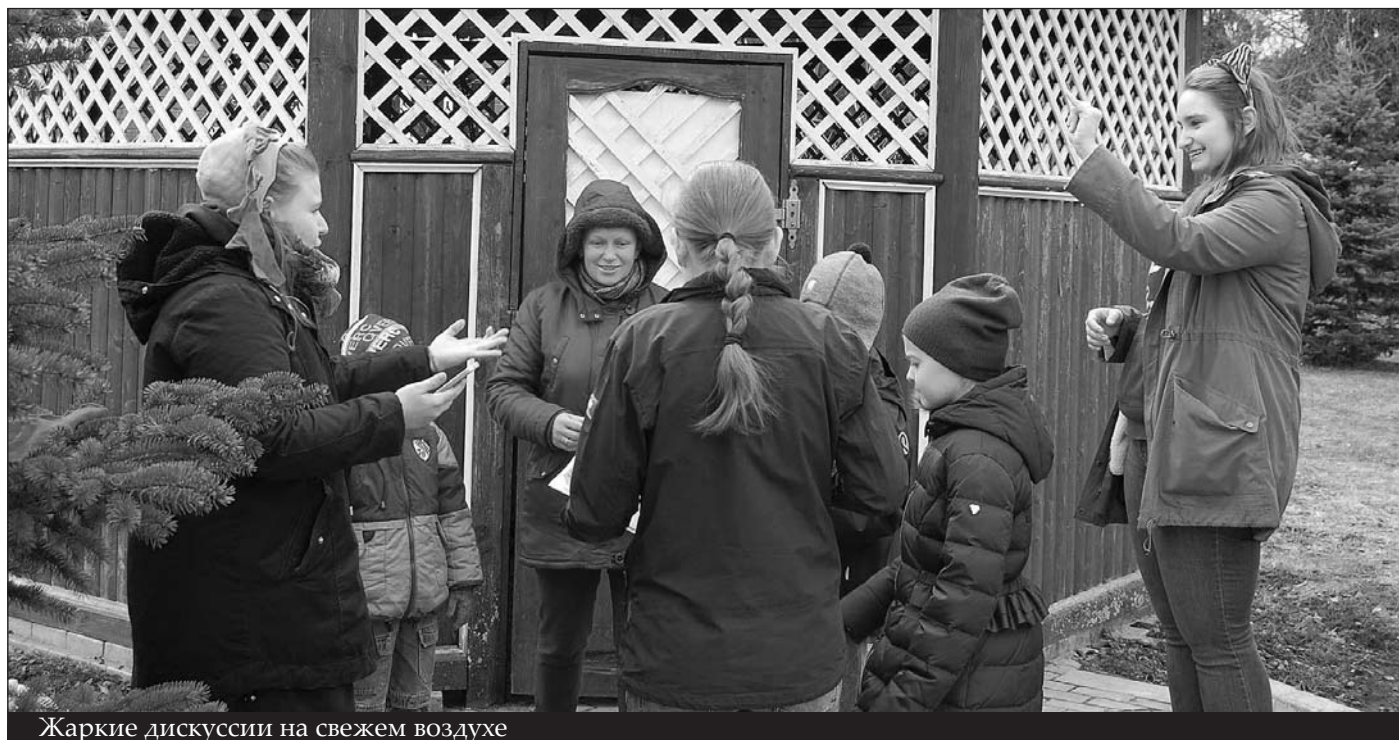
Жаркие дискуссии на свежем воздухе