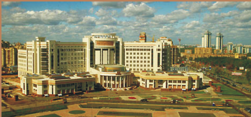
Учебный корпус МГУ №1