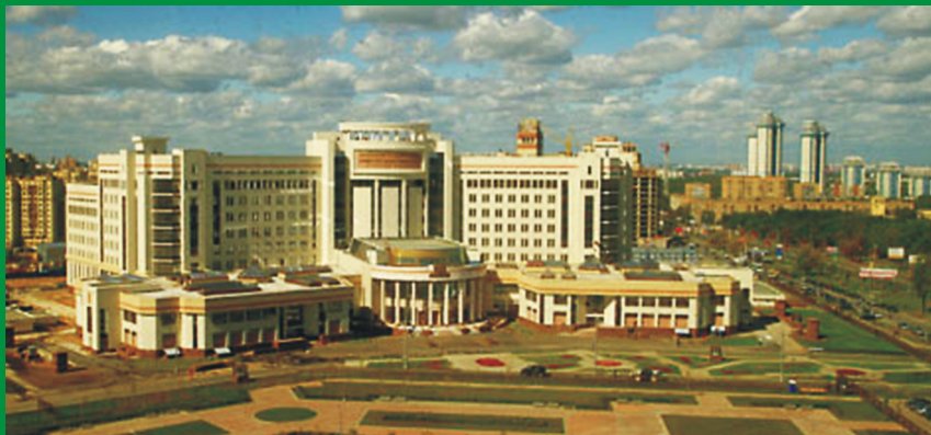
Учебный корпус МГУ №1