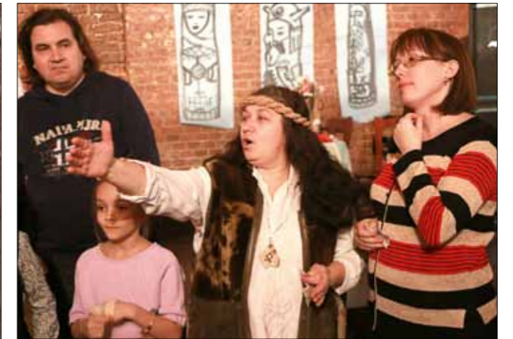
Наставления и пророчества от мудрейшей