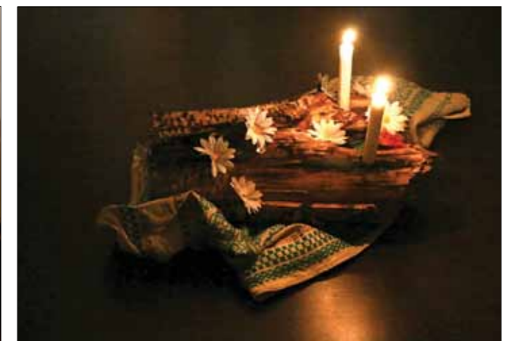
Пора и молодое солнце встретить