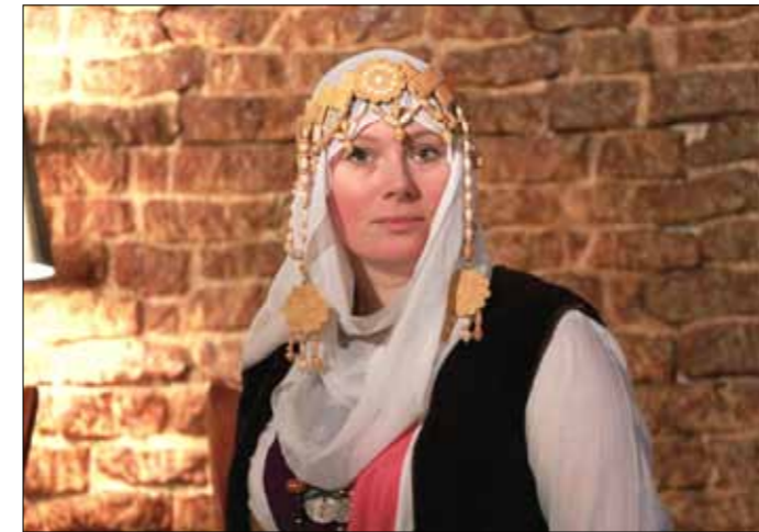
Матушка князя гостей встречает