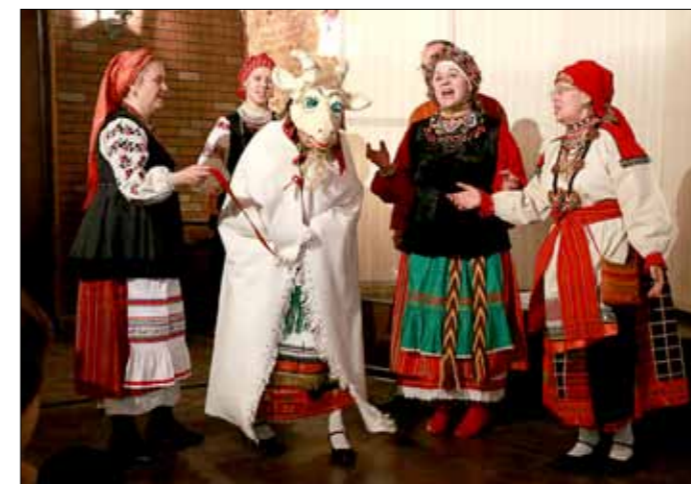
«Где коза рогом – там жито стогом»