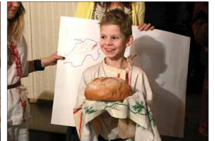
После пути долгого странника хлебом да солью встречаем