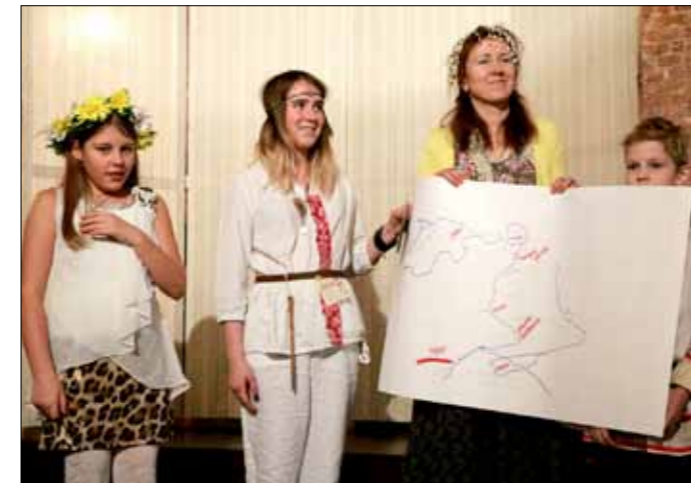
Долго ли, коротко ли по морям странствовали купцы наши