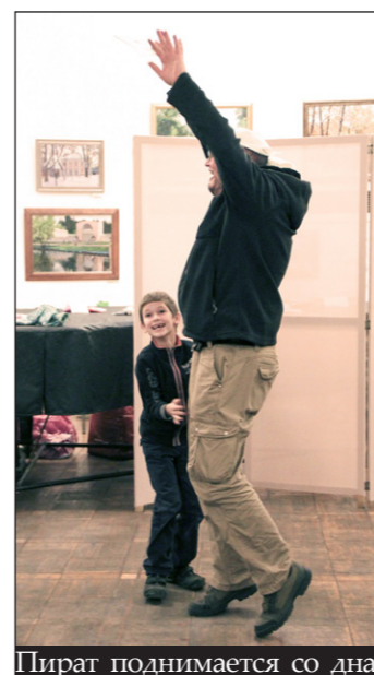
Пират поднимается со dna