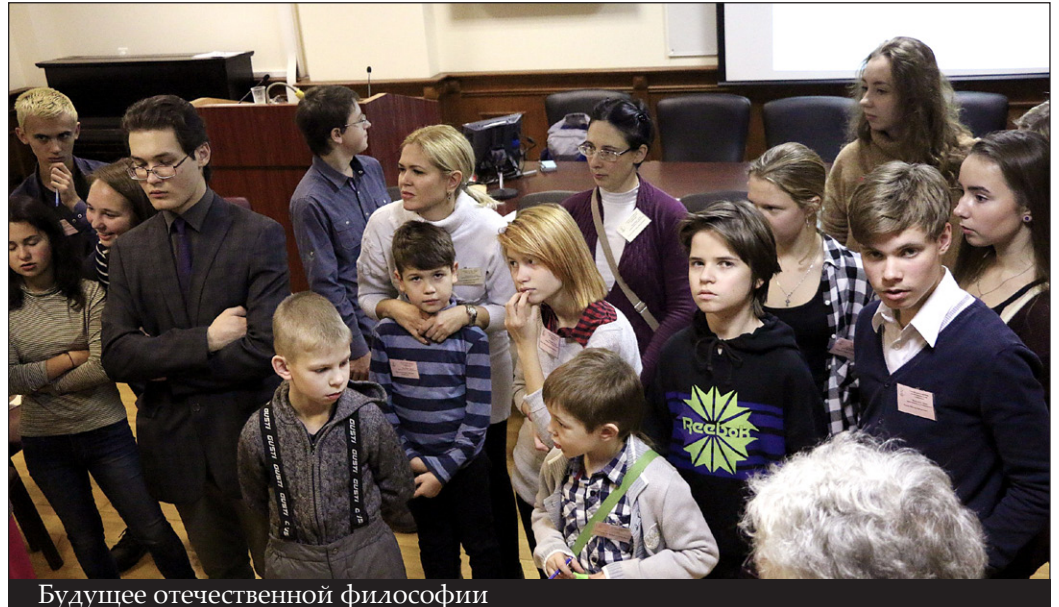
Будущее отечественной философии