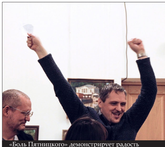
«Боль Пятницкого» демонстрирует радость